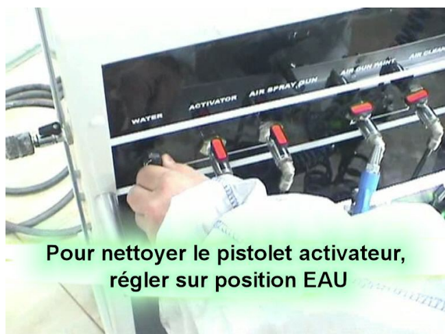
Pour nettoyer le pistolet activateur, régler sur position EAU

Ne pas utiliser de savon ou de détergeant pour le nettoyage. Un peu de javel dans de l'eau distillée permet un nettoyage très efficace des cuves, tuyaux et pistolets.